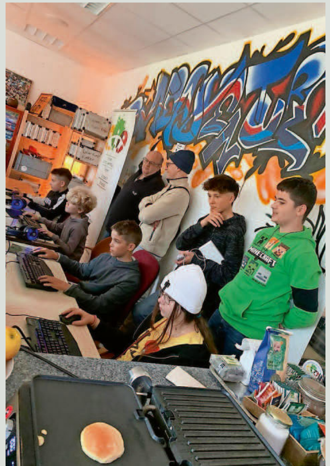
Der 2. Zockerbrunch im Kinder- und Jugendzentrum der Gemeinde Stegen (siehe Text innen)!