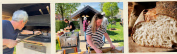
Impressionen vom letzten Backtag